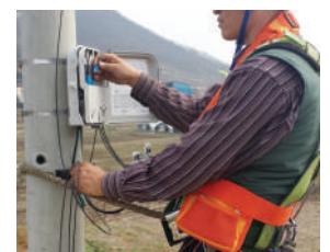
Использование ремня на столбе

Discover the difference, Unlike any other! Почувствуйте разницу, мы не похожи на остальных!